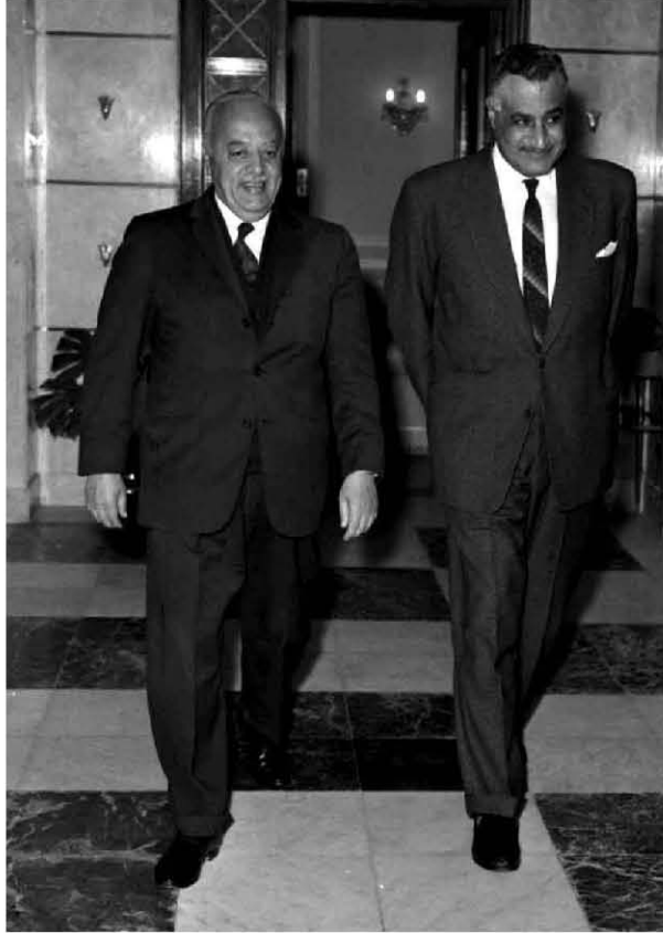
استقبال أحمد الشقيري رئيس منظمة التحرير الفلسطينية ١٩٦٧/١/٣١

مدى قدرة الشعب الفلسطيني على مواجهة مسؤولياته النضالية، والارتفاع فوق مستوى الأحداث والتحديات. تكتيل قواه.